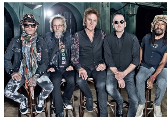
Legendäre Musiker kommen am 1. August in die Kulturkirche.

Tickets gibt es an Vorverkaufsstellen und online über www.reservix.de und www.eventim.de . Weitere Informationen erhalten Sie über 03391 355 53 00.