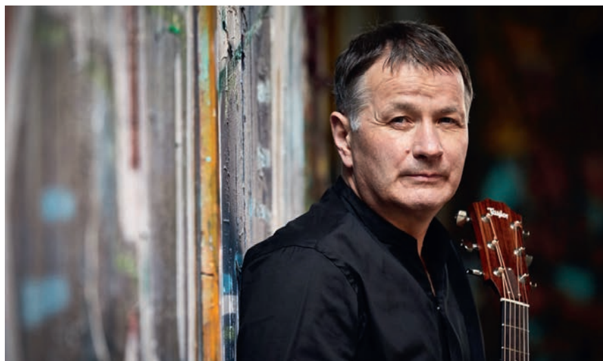
Ein ebenso vielseitiger Schauspieler wie ein begnadeter Musiker: Thomas Rühmann. Er kommt am 7. August in die Kulturkirche Neuruppin.

Thomas Rühmann, bekannt mit Arztkittel und Stethoskop als Hauptdarsteller der ARD Fernsehserie „In aller Freundschaft“ beweist in seinem neuen Solo-Programm „Lebenslieder“ einmal mehr seine Qualitäten als Sänger und Gitarrist am Samstag, den 7. August, in der Kulturkirche Neuruppin. Denn die Mehrfachbegabung macht neben der Schauspielerei auch noch überzeugende Musik.