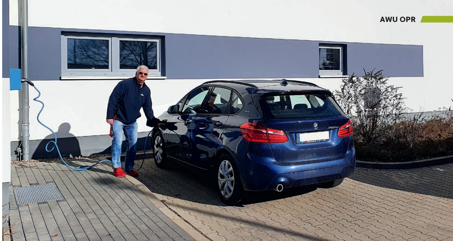
■ Klein, aber oho: Mit dieser Wallbox können E-Fahrzeuge am Betriebsgebäude der AWU OPR in Werder geladen werden.