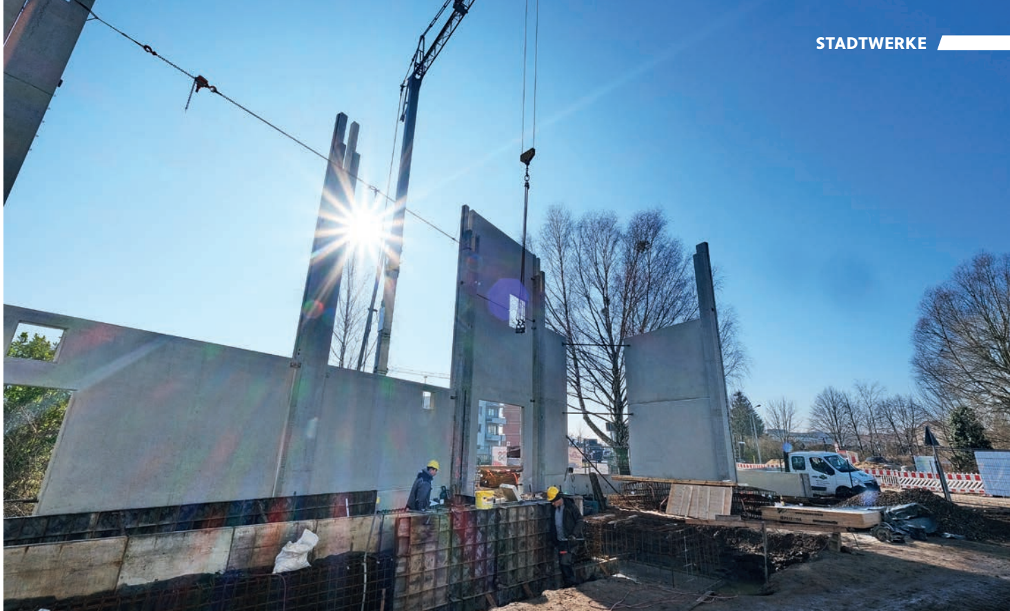
■ Auf ins Blaue: In der Ernst-Toller-Straße wachsen derzeit die Wände für das neue Feststoffkessel-Heizhaus der Neuruppiner Stadtwerke in die Höhe.