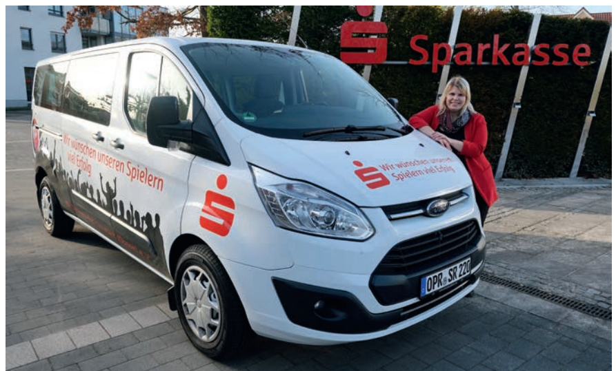
■ Sparkasse macht mobil: Dank der Unterstützung durch die Sparkasse Ostprignitz-Ruppin können die Mannschaften des Schwarz-Rot Neustadt bequem zu ihren Spielen fahren.