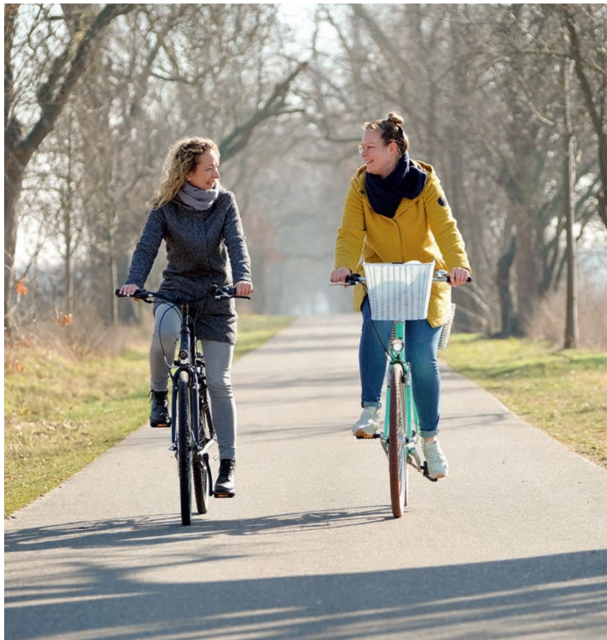
■ Dem Frühling entgegen: Die App Ruppin2GO enthält in ihrer neuesten Version nicht nur viele Verbesserungen, sondern auch eine Radtour um den Ruppiner See.

Und Ruppin2GO hält weitere Angebote und Schnittstellen zu Anbietern diverser Services bereit, mit denen der Nutzer die Region für sich neu entdecken kann, Veranstaltungen erlebt oder schaut, wo es die nächste Pizza gibt. „Neben den Services der Stadtwerke und unserer Partner bie-