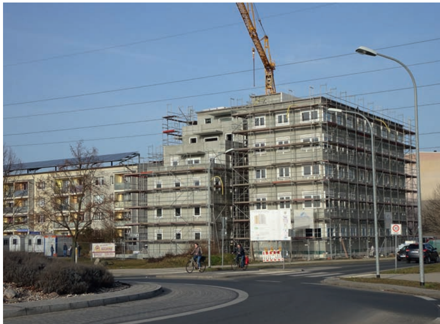
■ An die alte „Fischbüchse“ erinnert hier in der Thomas-Mann-Straße nichts mehr. Das Bauprojekt wird im dritten Quartal 2021 fertig gestellt sein.

Neue „Fischbüchse“ nimmt Gestalt an Das aufwändigste und kostenintensiv-