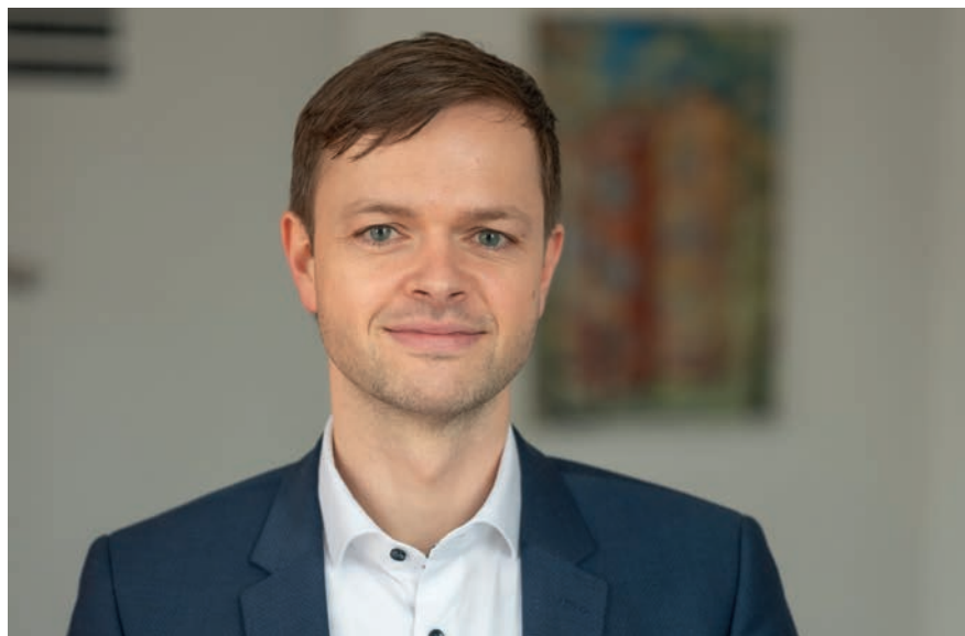
■ Nico Ruhle, Bürgermeister der Fontanestadt Neuruppin

In der aktuellen Ausgabe dreht sich alles um das Thema Mobilität, dessen Bedeutung uns in den verschiedensten Lebenslagen bewusst wird. Zurzeit bemerken wir vor allem die Einschränkungen aufgrund der COVID-19-Pandemie: Urlaubsreisen, große Familienfeste und öffentliche Veranstaltungen fallen größtenteils aus. Hier reihen sich leider auch viele beliebte Veranstaltungen in der Fontanestadt ein. Schweren Herzens mussten wir im Sinne der Sicherheit und Gesundheit aller Beteiligten den Jahresempfang der Stadt, das Mai- und Hafenfest am ersten Mai-Wochenende und die Lange Nacht der Wirtschaft im September absagen. Zudem wurde in Abstimmung mit dem Land Brandenburg entschieden, das 17. Brandenburger Dorf- und Erntefest, das im September im Ortsteil Wulkow stattfinden sollte, erneut um ein Jahr zu verschieben.