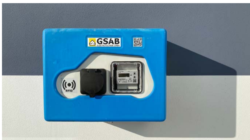
■ Wallboxen sind für private Nutzer von E-Autos eine Möglichkeit, das Fahrzeug daheim an der eigenen Steckdose laden zu können.

Reichweite des E-Motors gelangt sie nach Hause, ohne dass sich der Benzinmotor zuschalten muss. So werden lokale Emissionen vermieden. „Bald werden wir darüber hinaus als Ersatz für einen Diesel-PKW ein E-Auto anschaffen“, stellt Maximilian Noa in Aussicht. Auch die E-Bikes finden immer mehr Freunde unter den AWU-Mitarbeitern, der „eingebaute Rückenwind“ macht es für viele Radfahrer attraktiv, auch weitere Strecken zu wagen.